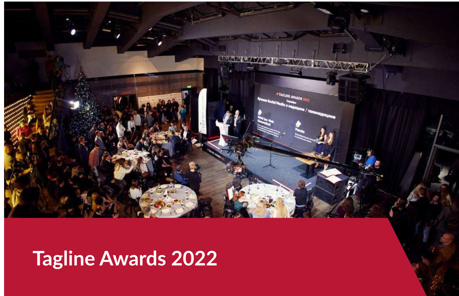
Tagline Awards 2022