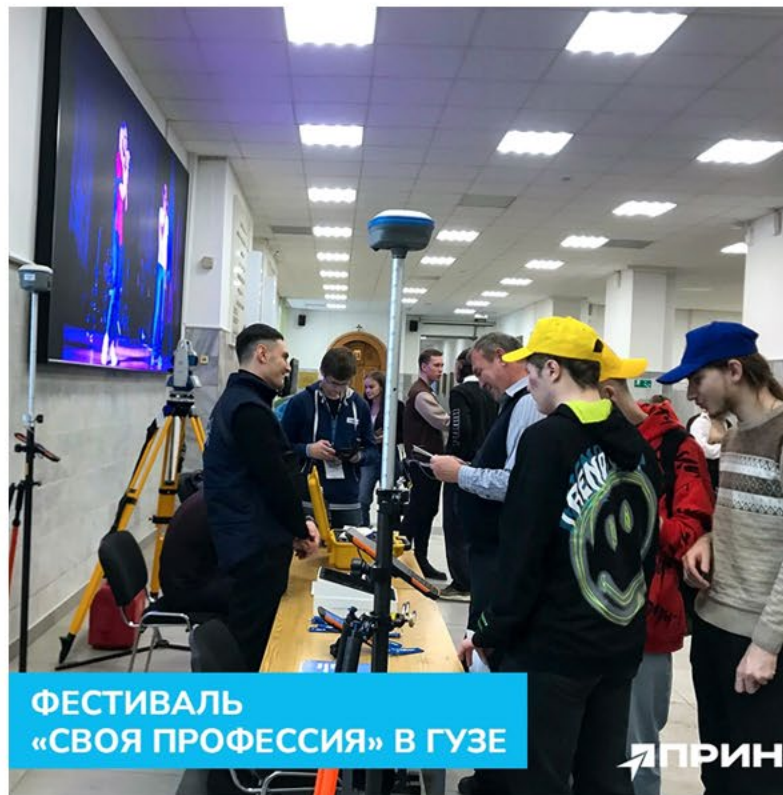
ФЕСТИВАЛЬ «СВОЯ ПРОФЕССИЯ» В ГУЗЕ

Конференции, демонстрации, встречи – обо всех значимых событиях, в первую очередь, рассказываем в социальных сетях.