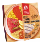
КИНОА С ТОМАТАМИ