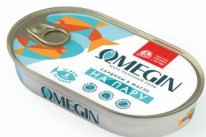
САРДИНЫ В МАСЛЕ