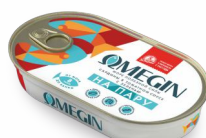
САРДИНЫ С ЗЕЛЕНЬЮ