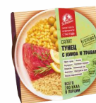
С КИНОА И ТРАВАМИ