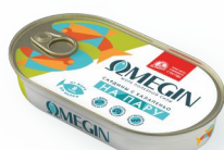
САРДИНЫ С ХАЛАПЕНЬО