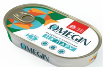
САРДИНЫ С КАПЕРСАМИ