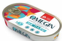
САРДИНЫ С ФАСОЛЬЮ