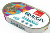
САРДИНЫ С МАСЛИНАМИ